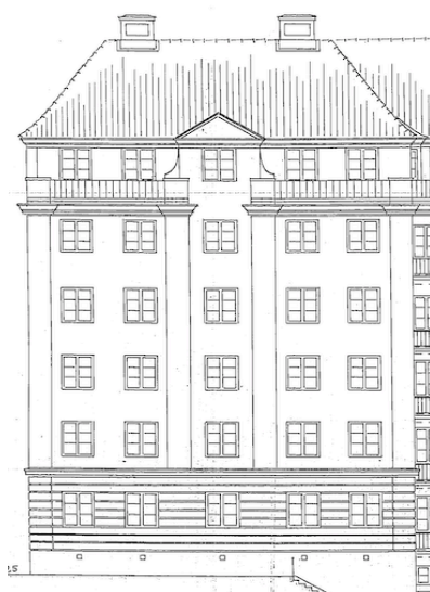
Bild 1. Fasad mot innergården

Arkitekturstilen hos Hyveln 29 är tjugotalsklassicism. På ritningen nedan (Bild 1) av fasaden mot innergården illustreras detta, här syns pilastrar i väggen och vid hörnen. Upptill övergår pilastrarna i ett slags kapitäl som sedan ingår i en fris. Uppe mot taket finns ett triangelformat element, ett tympanonfält, som också är inspirerat av klassiska byggnader. Notera de linjemarkeringar som finns vid nedersta våningen, så kallad rustifiering och är ett sätt att visuellt ge en byggnad en känsla av tyngd och stabilitet. Bottenvåningens rlinjerustifiering samt pilastrar i fasaden med kapitäl syns väldigt tydligt när man betraktar fasaden mot gatan.